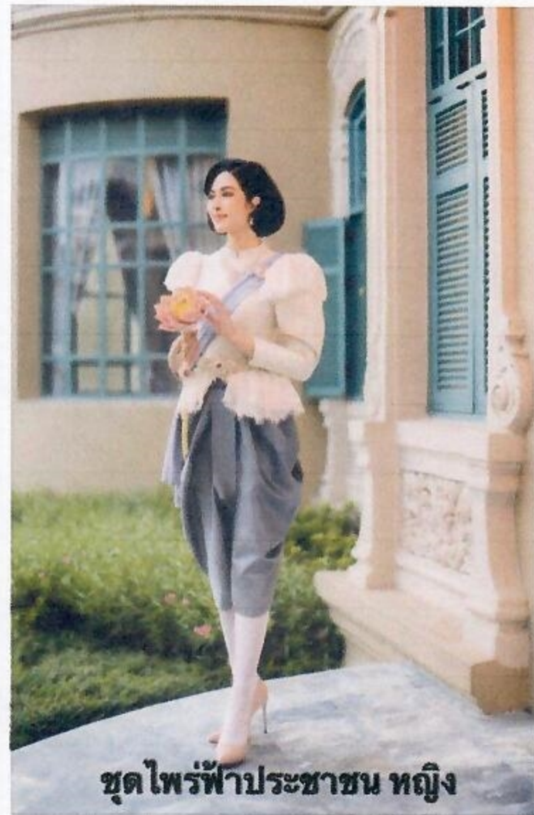
ชุดไฟรฟ้าประชาชน หญิง