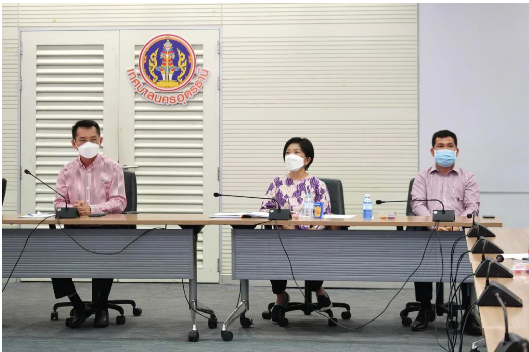
Cr. ภาพ/ข่าวจาก ฝ่ายประชาสัมพันธ์ กองยุทธศาสตร์และงบประมาณ

https://www.facebook.com/101193051457415/posts/pfbid02STpcmjsrftMyAHxqcpB1QvMeTaNGegg4BkhZKakq5xvBM7obbuNbVryMGs4Yu36il/?d=n