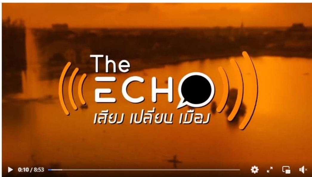
[EP.23] The Echo+TALK TO TOWN intensive english program

#TheEcho #TalkToTown #ฉนดรพุทธิรักษ์ #ดีอกเตอร่หรั่ง #เทศบาลนครอุดรธานี #ฝ่ายประชาสัมพันธ์ เทศบาลนครอุดรธานี